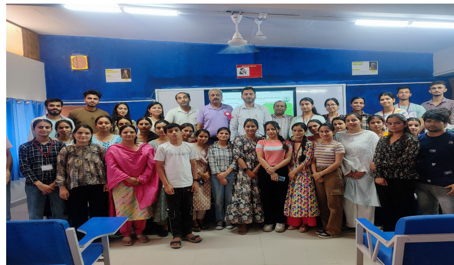
PHOTOGRAPHS OF THE EVENT