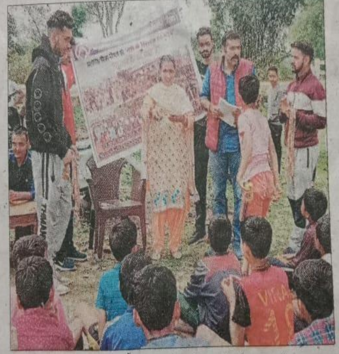
रैल में नरों के खिलाफ अभियान में मौजूद खिलाड़ी और अन्य लोग।

इस प्रतियोगिता में अंडर-10, अंडर-13, अंडर-15 और अंडर-18 आयु वर्ग की खेल प्रतियोगिताएं करवाई गईं। अंडर-