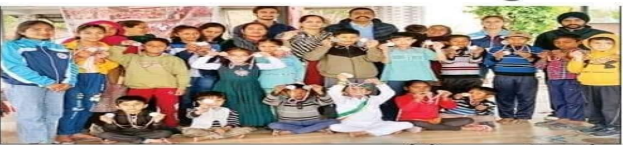
कार्यालय संवाददाता -हमीरपुर

विजेताओं को पंचायत प्रधान ने बांटे पुरस्कार